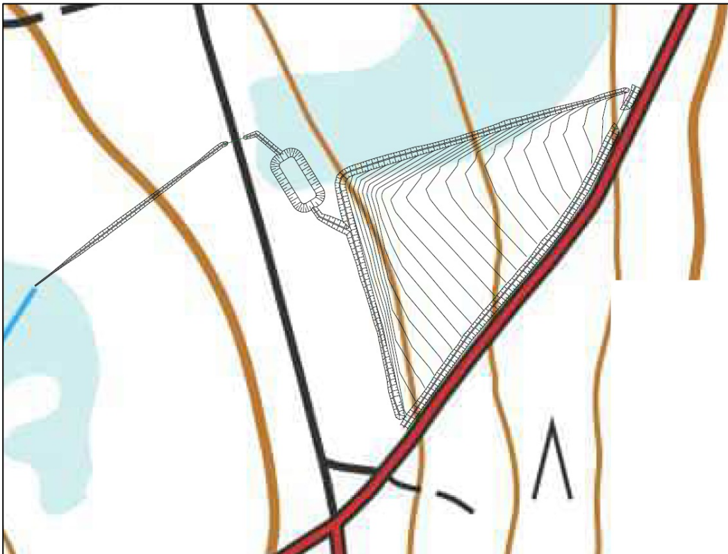
Kuva 1. Läjitysalue 1 sijainti (kuva muokattu suunnitelmapöytäkuva 6.9.2024, Afry)

Läjitysalue 1 sijaitsee Rovaselän luoteispuolella välittömästi tieuran vieressä (kuva 1). Toinen tieura kulkee noin 40 metrin päässä läjitysalueen länsipuolella. Alueella olevien tieurien varressa on nykyisellään kuivatusojat tai ojapainanteet. Välittömästi läjitysalueen lähistöllä ei ole tiedossa olevia lähteitä. Lähin vesistö on alueesta lounaaseen sijaitseva Rovajärvi, johon on etäisyyttä läjitysalueen eteläisimmästä kohdasta noin 460 metriä. Alue on nykyisin luonnontilainen ja pohjaa moreenia. Rakennettavasta selkeytsaltaasta vedet johdetaan ojaan, josta vedet edelleen kulkevat luonnontilaisia ojia pitkin Rovajärveen.