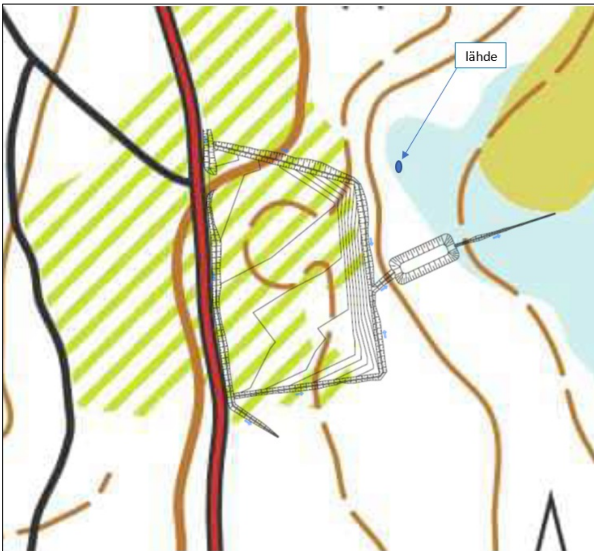
Kuva 3. Läjitysalue 3 sijainti (kuva muokattu suunnitelmakartasta 6.9.2024, Afry).

Rakennettavasta selkeytysaltaasta vedet johdetaan suolle imetykseen, josta vedet edelleen kulkevat luonnontilaista Rättiojaa pitkin Martinjärveen.