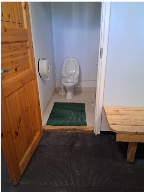
Huoltorakennuksen pukuhuoneissa ei ole esteetöntä WC:tä.