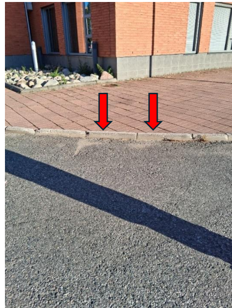
Punaisten nuolten osoittama kynnys madalletaan.