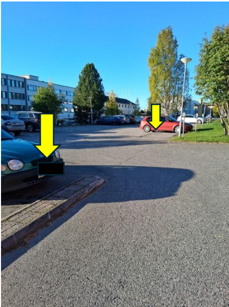
Invapaikat merkitään keltaisten nuolten osoittamille paikoille.

Ehdotetaan invapaikkojen lisäämistä kaupungintalon päädyssä olevalle Luusuantien suuntaiselle parkkipai- kalle alla olevien kuvien mukaisesti.