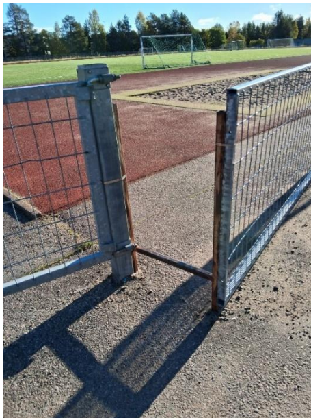
Kulku urheilukentälle on estynyt apuvälineillä liikkuvilta henkilöiltä sekä henkilöiltä, joilla on liikkumisen vaikeutta.

Ehdotetaan urheilukentän ja huoltorakennuksen korjaamista esteettömäksi.