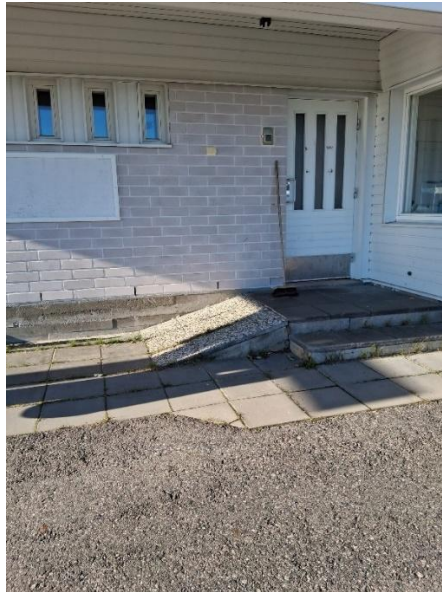
Pääoven edustalla olevan porrastasanne on ahdas, kun tasanteella on pyörätuoli ja ovi pitäisi avata.