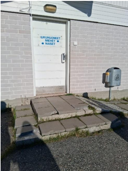
Pukuhuoneisiin johtavan ulko-oven portaat ovat lohkeilleet. Porrastasanne on ahdas pyörätuolille.

Havaittiin, että urheilukentällä sisätiloihin pääsy apuvälineillä kulkeville ei ole esteetöntä.